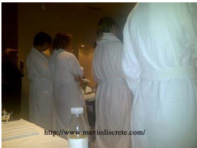
Nous, en peignoirs!