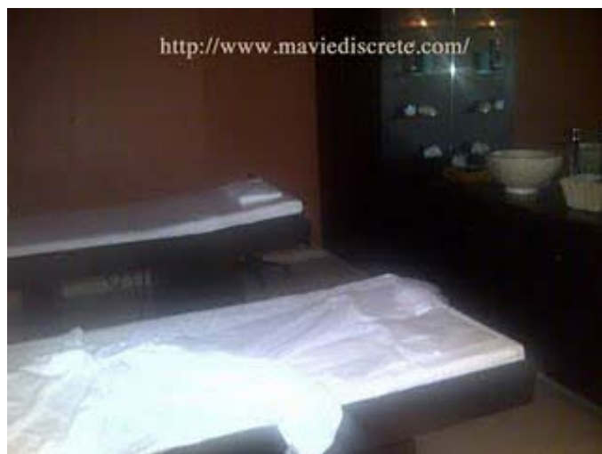
La salle pour les soins «complices», j'adore ce concept!