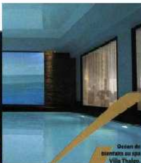
Desan de bien-être au spa Villa Thalgo.