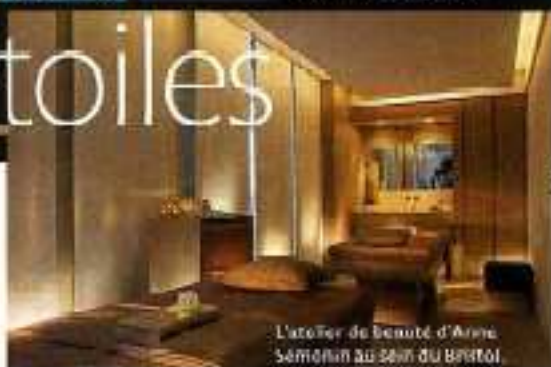
L'atelier de beauté d'Arno Sémanin au sein du Bristol.

LE RAFFINEMENT EXTRÊME D'UN PALACE POUR NAGER, UN TEMPLE HIGH-TECH OÙ S'OFFRIR DES SÉANCES PRIVÉES DE MUSCU, UN ÉCRIN DE RÊVE OU PRATIQUER L'AQUAGYM... DES LIEUX ET DES PROGRAMMES D'EXCEPTION POUR S'OCCUPER DE SOI.