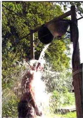
1_ et 2_ Facade et salon de repos du spa Pure Altitude des Fermes de Marie 3_ et 4_ La baignoire en bois façon bain suédois et la douche écolo du spa Un lit au pré