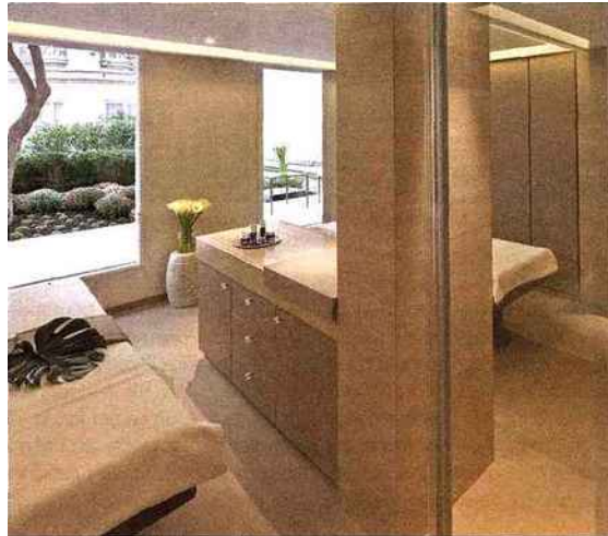
Le spa de l'hôtel Le Bristol by La Prairie

Le mémorable "watsu", contraction de "water" et "shiatsu", une thérapie tout en douceur dans de l'eau de mer chaude.