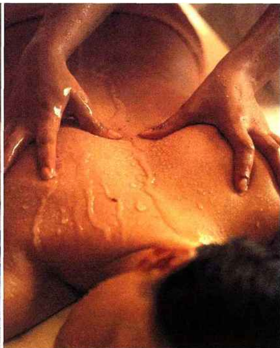
et un des massages proposés par la maison